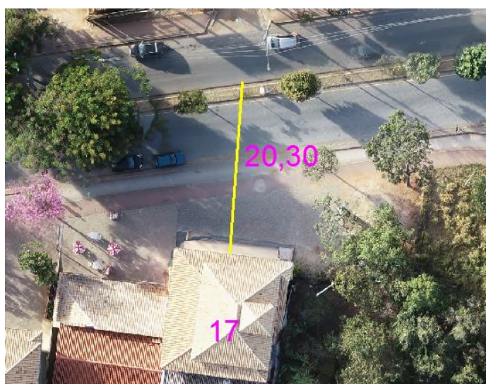
Figura 05 – Construção no Lote 17 a uma distância de 20,30 m da antiga pista da Rodovia.

Analisando os documentos atuais do Município, através da Imagem Georreferenciada obtida no ano de 2020, após as obras de duplicação da Rodovia MG-010, a construção da ciclovia e do passeio, encontramos a distância de 20,30 metros da área construída no Lote 17 até a antiga pista da Rodovia MG-010. Ou seja, com a duplicação da Rodovia MG-010, foram ocupados uma parte da Faixa considerada como Área Verde no Loteamento Áreas Residenciais Recanto da Serra.