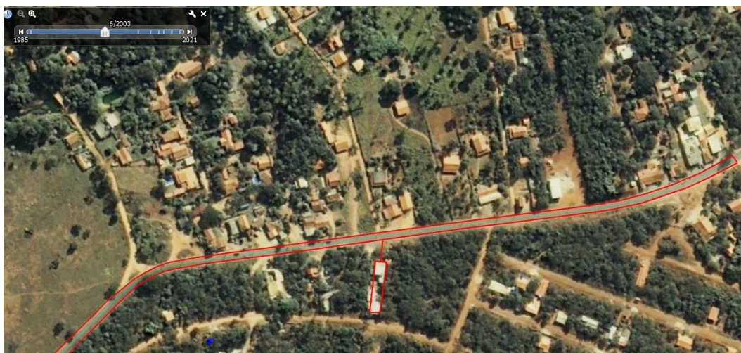
Figura 03 – Rodovia MG-010 com apenas uma Pista Simples implantada.

Fazendo uma pesquisa no Google Earth, observamos numa imagem de 2.003 quando a Rodovia MG-010 ainda não era duplicada, que já possuía algumas construções da Quadra 02 implantadas no Loteamento. Analisando o Lote 17 da Quadra 02 encontramos uma distância de 20,30 metros entre a área construída e a margem da Rodovia MG-010.