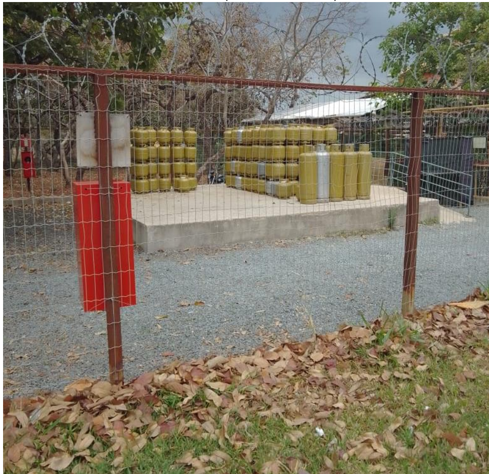
LOTE 23 (PARTE DO LOTE)