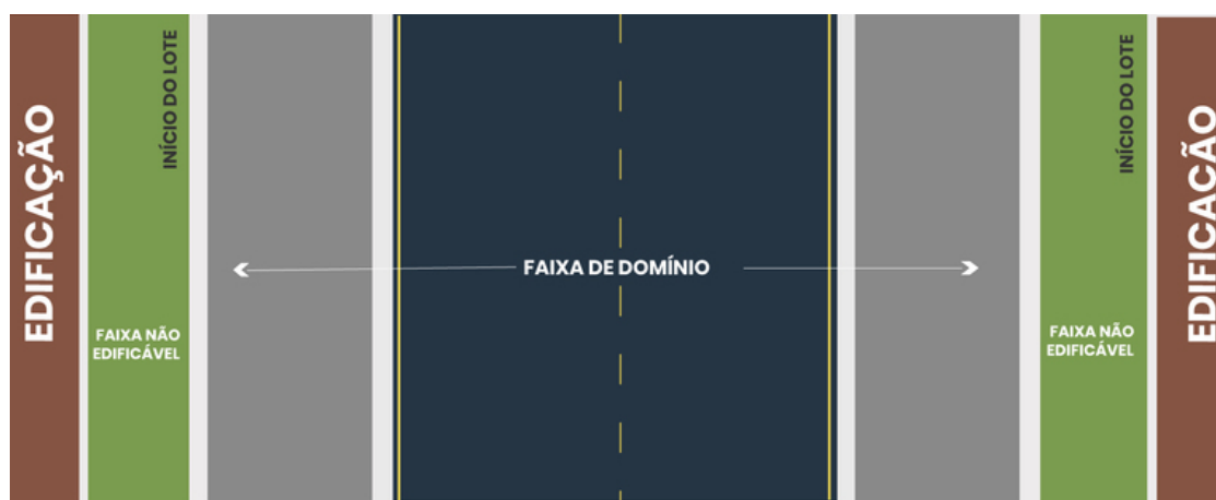
Figura 01 – Ilustração de indicação de Faixa de Domínio e Faixa não edificável.

Ao analisar o Projeto do Loteamento Áreas Residenciais Recanto da Serra, identificamos que não foi indicado no Projeto ao longo da Rodovia MG-010, a Faixa de Domínio do DER-MG e muito menos a Faixa não Edificável.