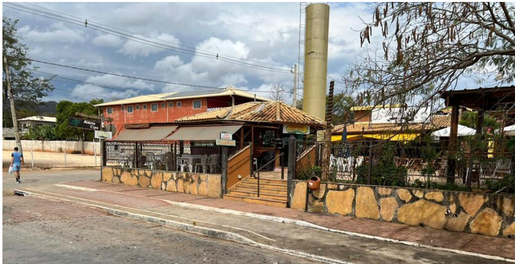
LOTES 37 E 38