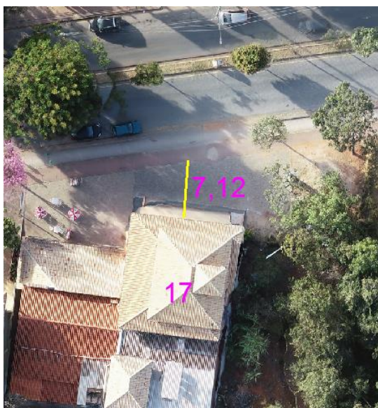
Figura 06 – Área construída no Lote 17 com uma distância de 7,12 m da rodovia após a duplicação da mesma.

O que restou da faixa entre a construção no Lote 17 e a Rodovia foi uma distância de 7,12 metros, ou seja a duplicação da Rodovia ocupou 13,17 metros da Área Verde.